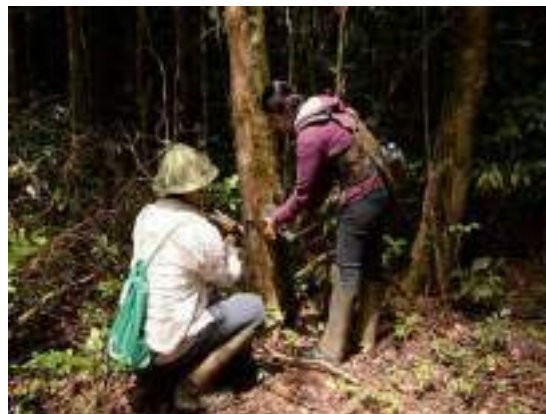
Field work during some courses